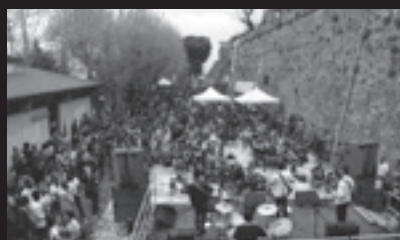
Percorsi della memoria