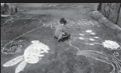
Al GAPA cresce Scuola e Libertà