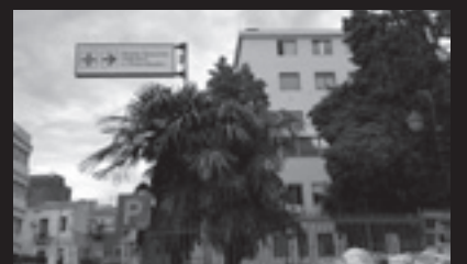
"U Santu Bambino era una cosa bella"