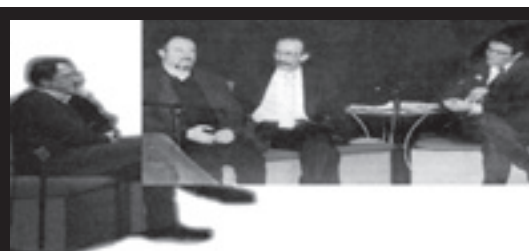
"La Sicilia" ipocrisia di un quotidiano