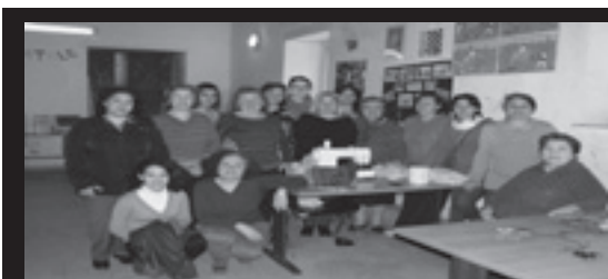
Ago e filo, taglia e cuci!

Nostri, di noi catanesi onesti e poveri. A noi li hanno rubati, a noi devono tornare.