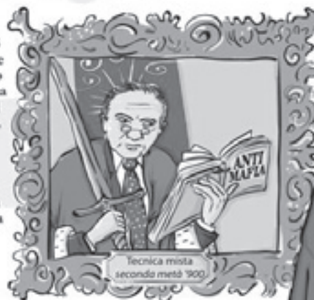
Tecnica mista seconda metà '900