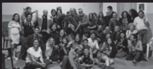
I prossimi trent'anni

Hanno dimostrato che la mafia si può colpire nei suoi interessi e nei suoi denari. Lo hanno dimostrato ottenendo l'assegnazione di un bene confiscato a Benedetto Santapaola, detto Nitto il mafioso (come lo definiva Giuseppe Fava), che ora è diventato il "Giardino di Scidà" in via Randazzo, 27.