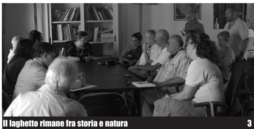
Il laghetto rimane fra storia e natura