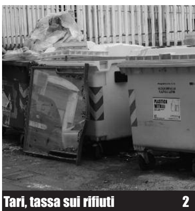
Tari, tassa sui rifiuti