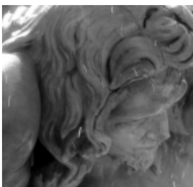
L'isola che non c'è