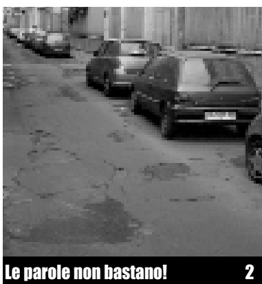
Le parole non bastano!