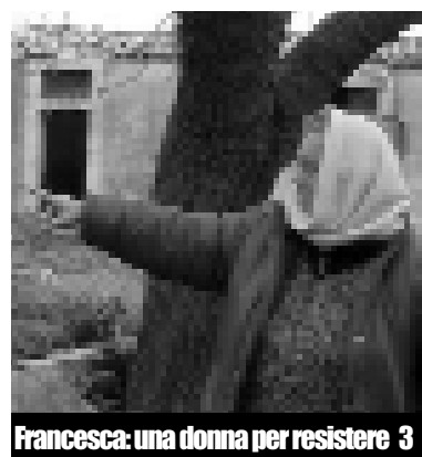
Francesca: una donna per resistere 3