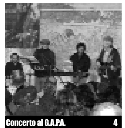
Concerto al G.A.P.A.